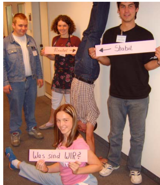
Zusammenspiel von Flexibilität und Stabilität