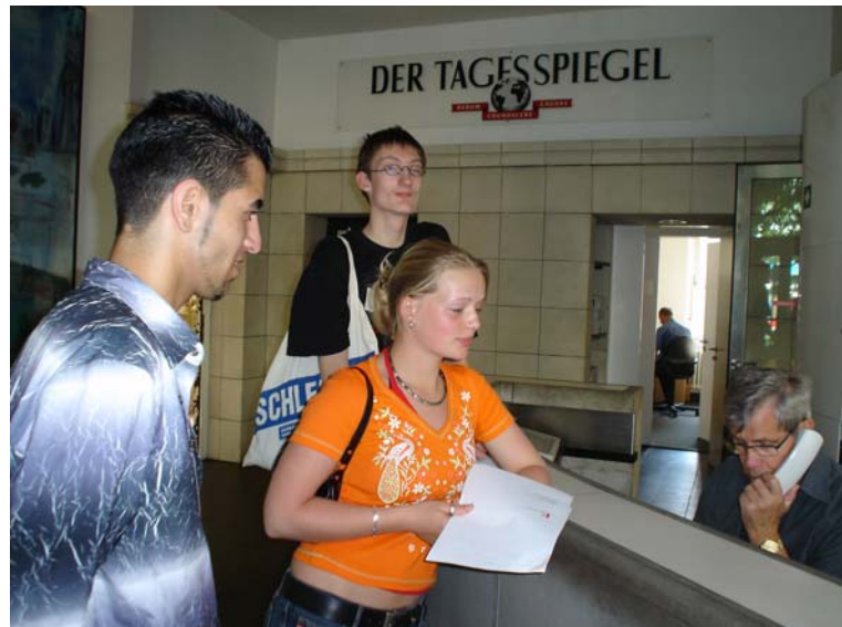
Live vor Ort!