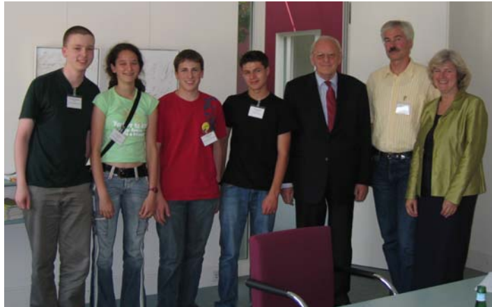
Wir sind im Max Liebermannhaus!

Württemberg 1980 1987 1994 - 1999 Bundespräsident der Bundesrepublik Deutschland.