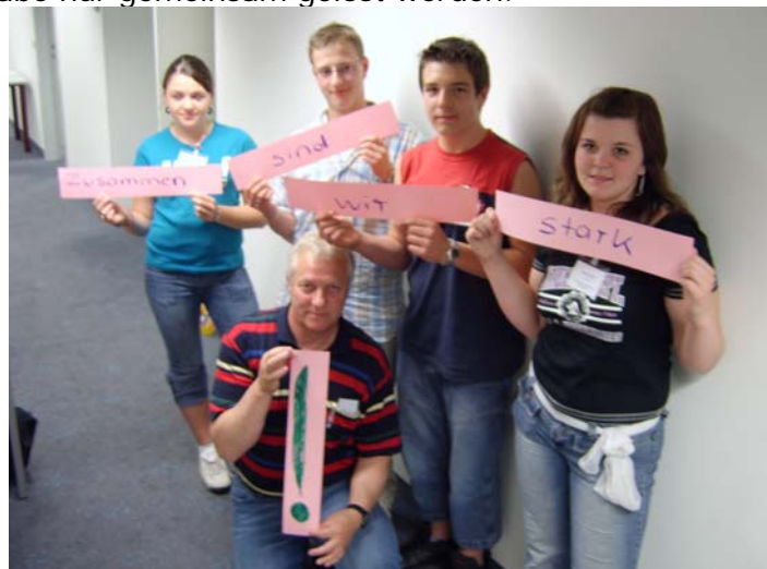
T ...wie Team! Heißt Zusammen sind wir stark!