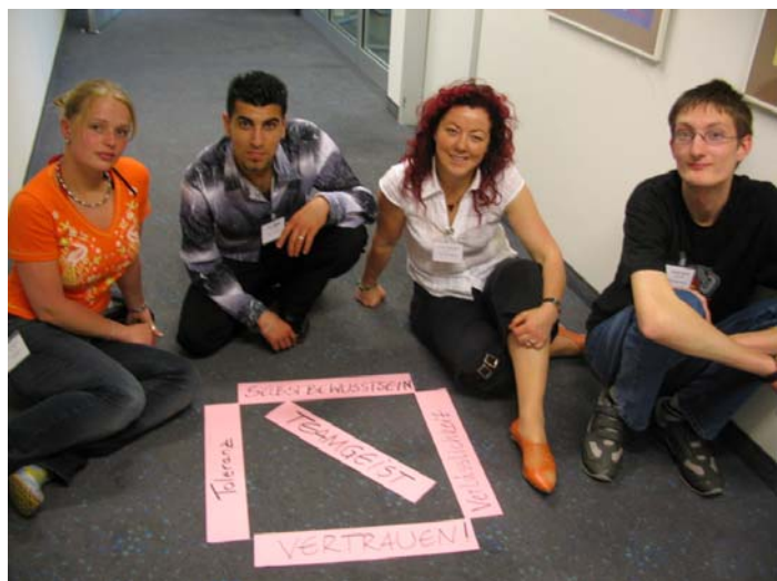
Das Interview-Team für den Tagesspiegel