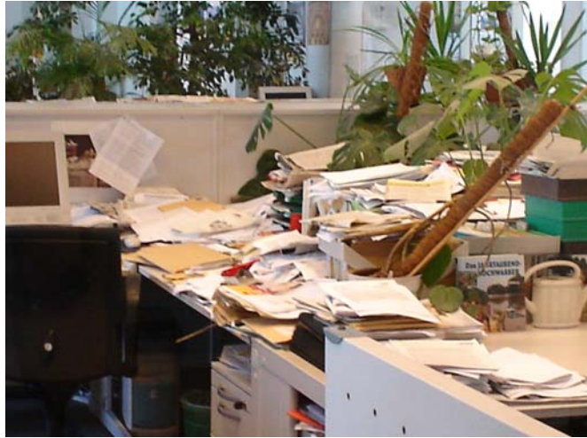
Das Chaos bei einem Journalisten!