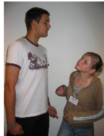
Unser Bild zum Selbstbewusstsein