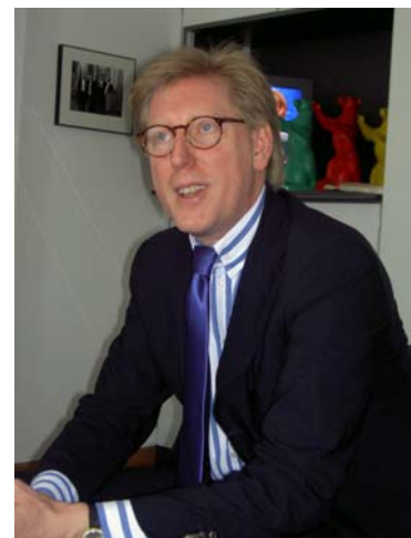
Fernsehmoderator bei Frontal